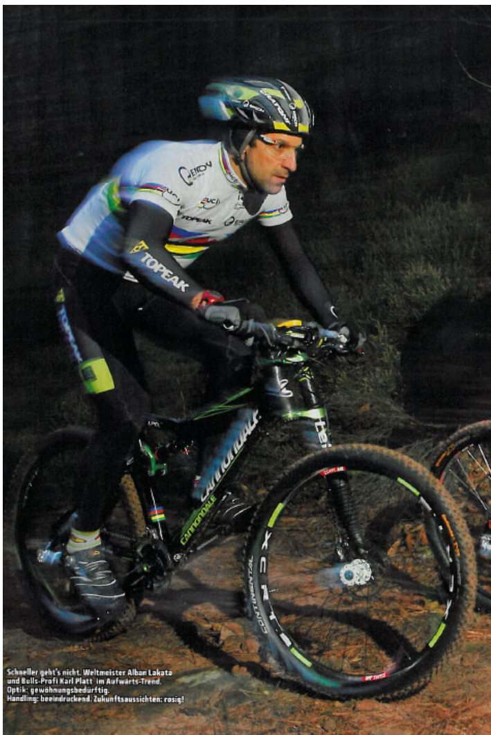
Schneller geht's nicht. Weltmeister Alban Lakata und Bulls-Profi Karl Platt im Aufwärts-Trend. Optik: gewöhnungsbedürftig. Handling: beeindruckend. Zukunftsaussichten: rosig!

« Gottlob bringt das Leichtgewicht nur unglaubliche 8,45kg auf die Waage-satte 800 Gramm weniger als der nachste Verfolger »